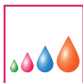
Piezo a goccia variabile