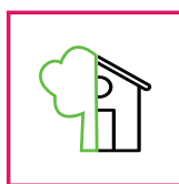
Esterni / Interni