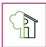
Esterni / Interni